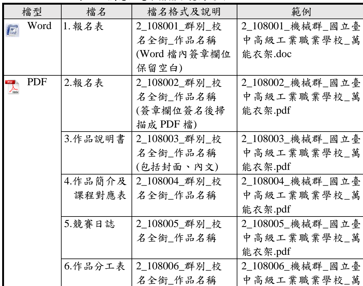
表 1-4 創意組電子檔檔名範例說明