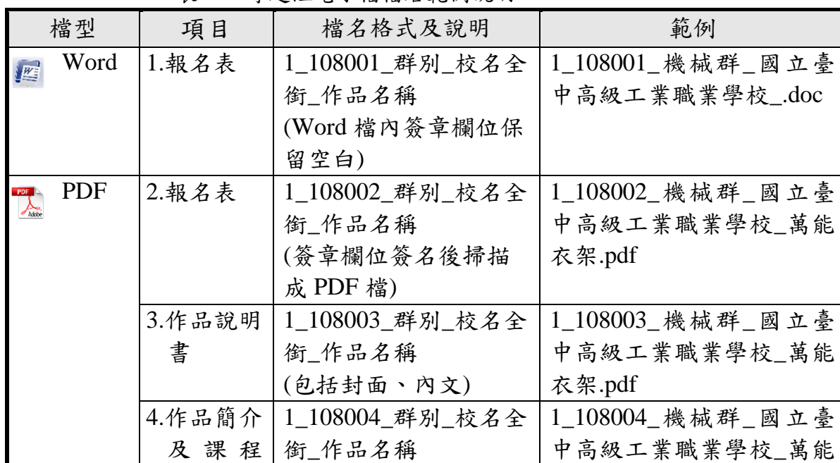
表 1-2 專題組電子檔檔名範例說明