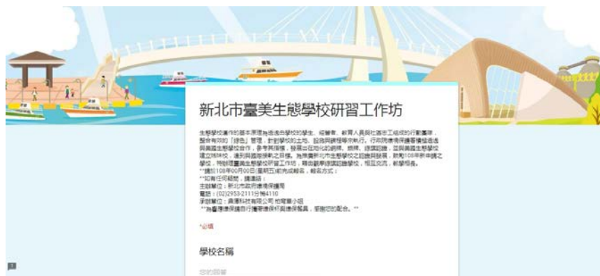
圖 1 「臺美生態學校研習工作坊」報名頁面(範例)