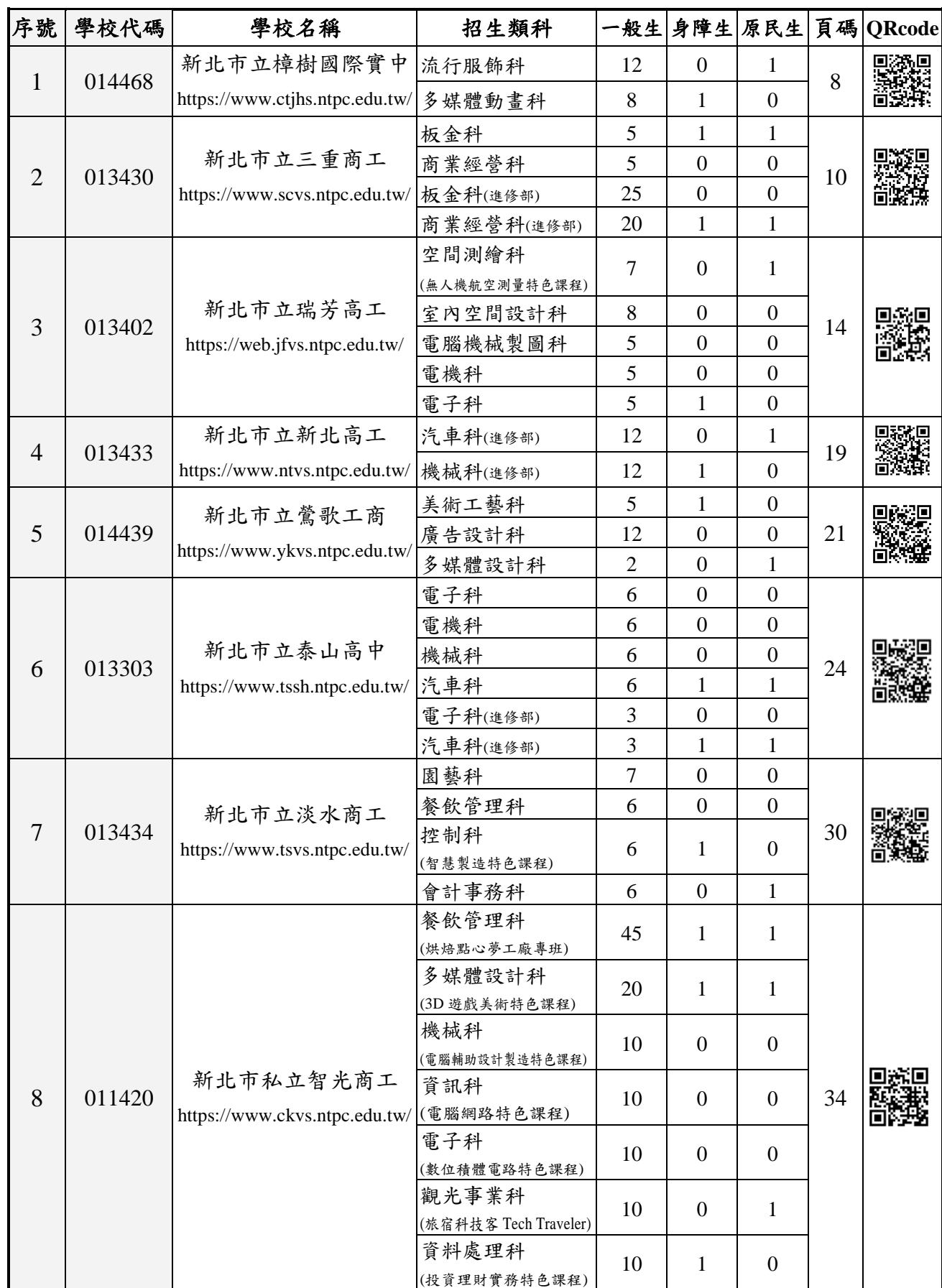
115 學年度新北市高級中等學校特色招生專業群科甄選入學招生學校一覽表